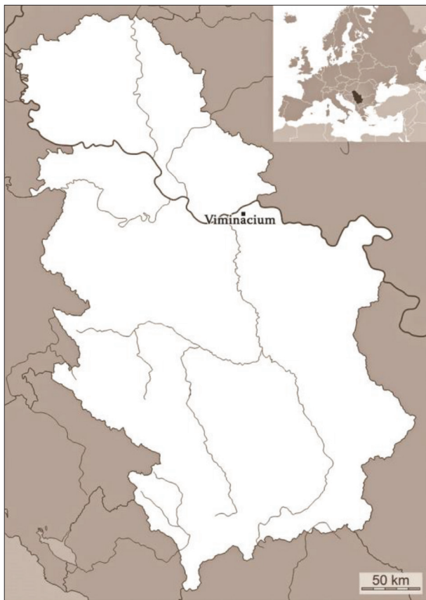
Figure 1. Location of Viminacium according to the contemporary geographical map of Serbia

Slika 1. Lokacija Viminacijuma na sadašnjoj mapi Srbije