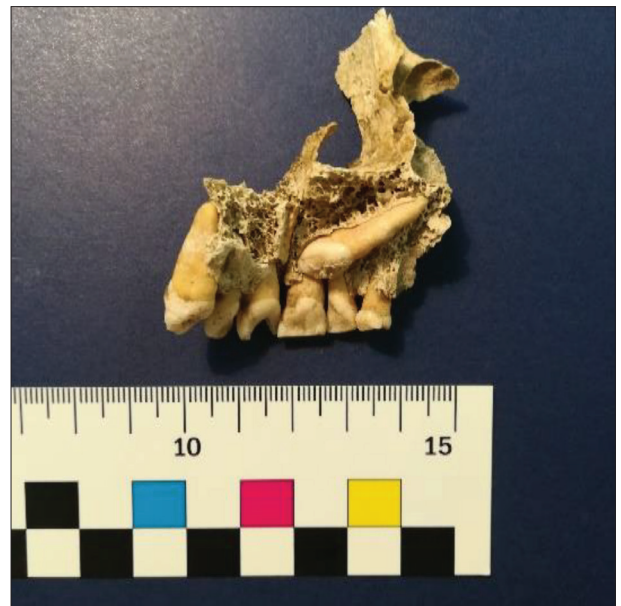
Figure 6. Impacted upper canine of an adult

Periapical processes were determined by direct inspection due to the bone loss in the projection of a bone defect. Six of these cases were observed, representing less than one percent (0.7%) of teeth with pathological changes that could have been the etiological factor (cause) of this occurrence. Namely, when calculating this percentage, it was necessary to include teeth from position 1 and position 3 (teeth lost after death) but also positions 4 and 5 (present