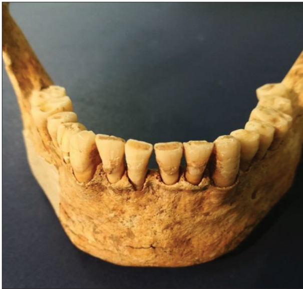
Figure 4. Grade II abrasion and grade I deposits on the teeth of an adult

Slika 4. Abrazija drugog stepena i kamenac prvog stepena na zubima odrasle osobe