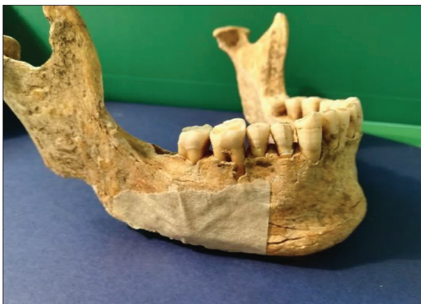
Figure 5. Erosions in the neck of the inferior premolars of an adult

Slika 4. Abrazija drugog stepena i kamenac prvog stepena na zubima odrasle osobe